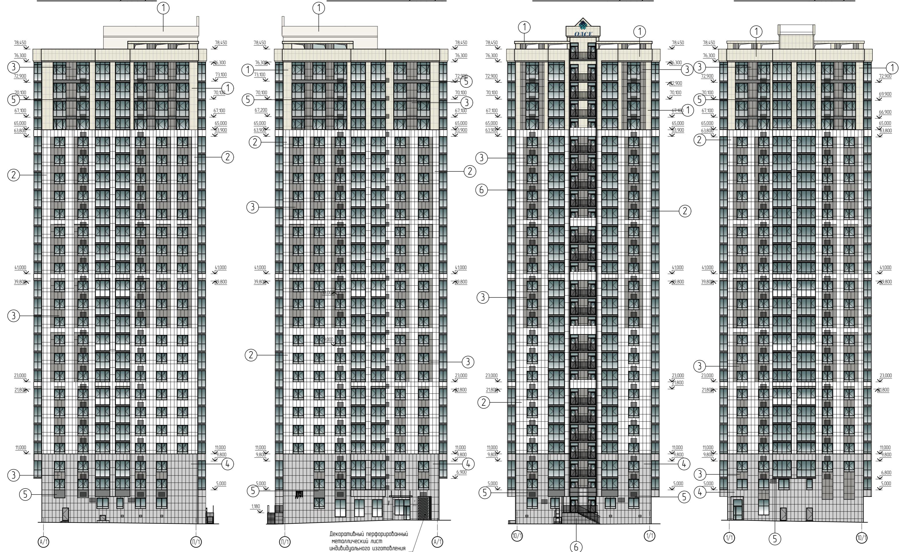
Фасад в осях 1/1-10/1