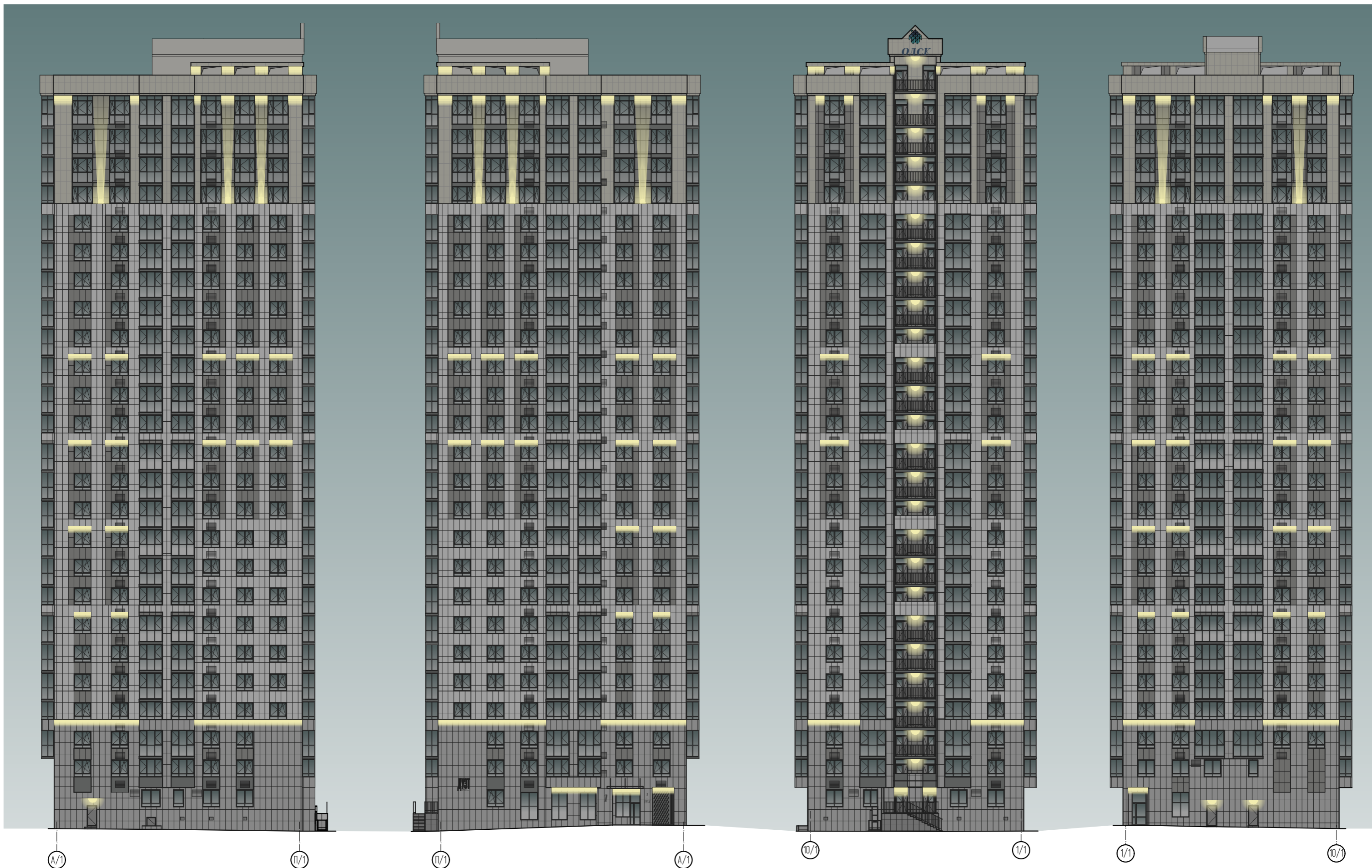
Фасад в осях 1/1-10/1